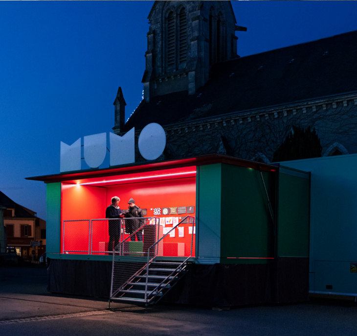
Le MuMo x Centre Pompidou conçu par Hérault Arnod Architectures et Krijn de Koning, artiste © Quentin Chevrier