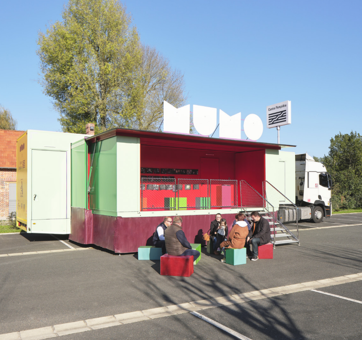
Le MuMo x Centre Pompidou conçu par Hérault Arnod Architectures et Krijn de Koning, artiste © Klaus Stoeibler