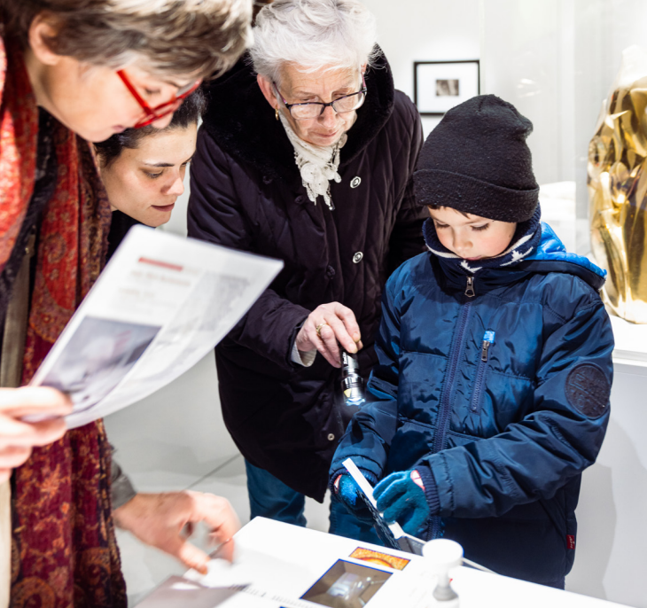
Le MuMo x Centre Pompidou conçu par Héroult, Arnod Architectures et Krjvn de Koning, artiste