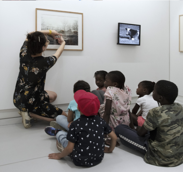
Le MuMo x Centre Pompidou conçu par Héroult, Arnod Architectures et Krjvn de Koning, artiste